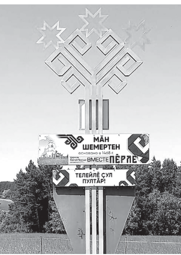
Стела перед селом Большие Шемердяны

«Все проекты инициативного бюджетирования мы поддерживаем. И исходим здесь из простой логики: если люди вкладывают свои деньги в решение какой-то проблемы, то, очевидно, эта проблема имеет очень важное значение для этого населенного пункта», - сказал Глава Чувашии Олег Николаев. - И это нас радует. Значит, у жителей поселений есть реальные возможности решить наиболее проблемные.