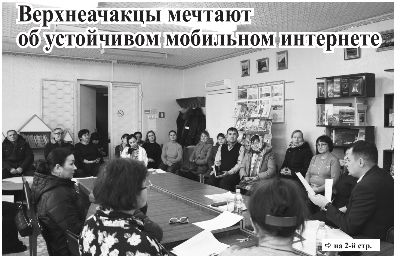
Встреча с населением в Верхнеачакской сельской библиотеке