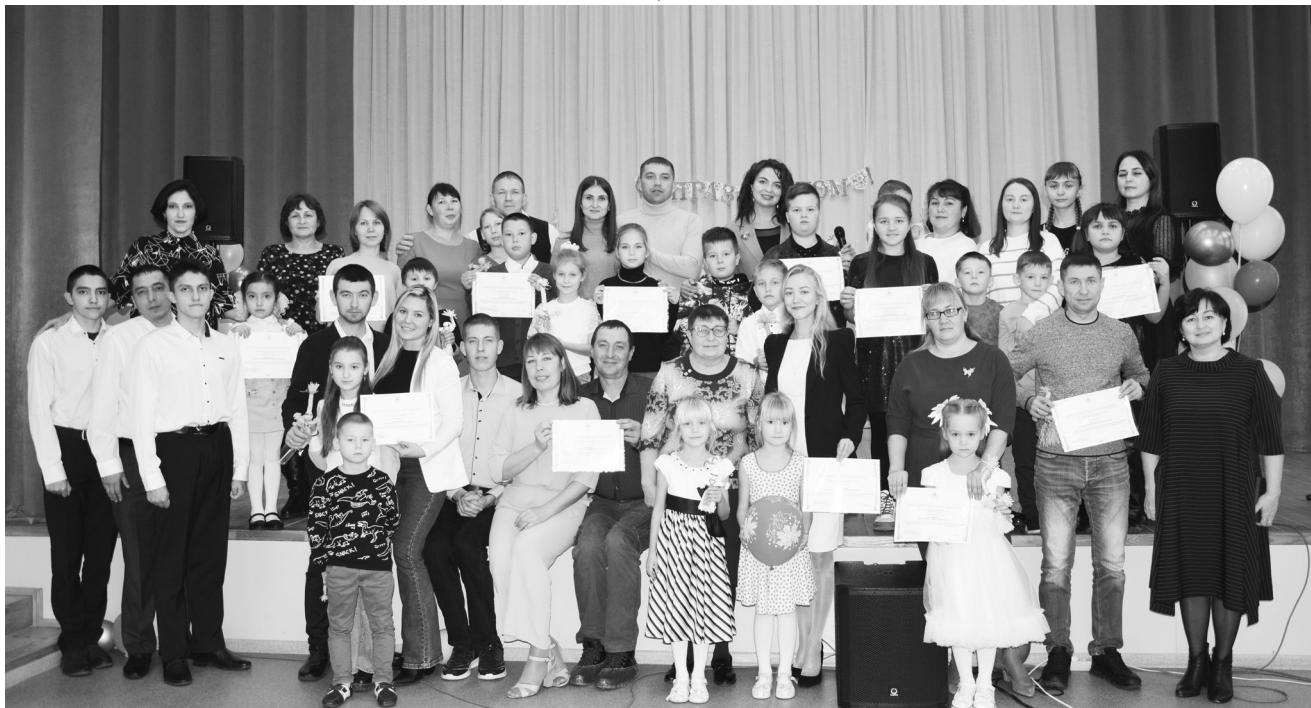
Участники конкурса «Семья года»

В фестивале приняли участие 13 молодых семей округа.