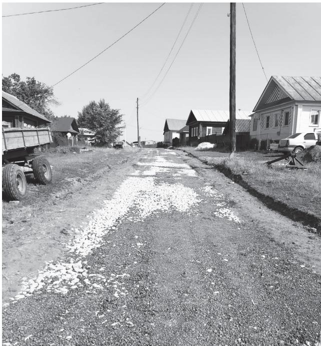
Переулочек Нагорный деревни Емалоки