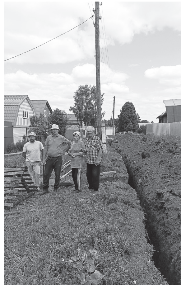
Строительство водопровода в д. Торхлово